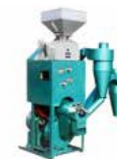
En stor rismølle, der vil dække andelsforeningen i Chansars behov. Det kræver en stor opsparing at kunne indkøbe den.

forholdsvis stor andel af ris (ca. 10 - 15 %) vil blive anvendt til svinefoder, ligesom der må påregnes en vis mængde urenheder og halve ris i den polerede fraktion. Men forarbejdningsgraden passer tilsyneladende fint til forventningerne og efterspørgslen i lokalområdet, og foreningen har allerede indgået kontrakter om afsætning af svinefoderet, ligesom der er håndslag på afsætningen af den polerede ris.