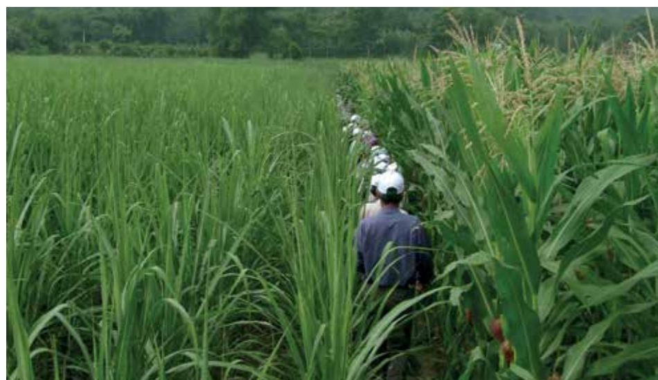
Til december slutter to projekter, ”Styrkelse af bondegrupper blandt etniske minoriteter, fase II” (CDEM-projektet) og ”Juridisk bistand til landbefolkningen, fase II”. Samarbejdspartnerne har været henholdsvis ”Vietnamese Farmer Union” og ”Vietnamese Lawyers Association”.

ADDA Fælledvejens Passage 2 st.tv, 2200 Kbh. N. www.adda.dk