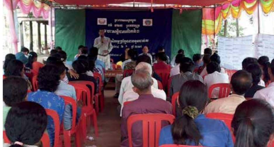
AC i Chansar afholder deres 3. generalforsamling.

Foreningsbestyrelsen har i samråd med rådgivere fra ADDA/READA udarbejdet en forretningsplan - der beskriver mål, forventet afsætning, salgspriser, kontrakter, investeringerne, forventet økonomisk resultat, forretningsgange, den daglige drift, hvem har ansvar for hvad, aflønning, bogholderi og revision, udbyttedispensering i foreningen, udarbejdet SWOT analyse og så videre. Senest har bestyrelsen forklaret og svaret på spørgsmål til de svage elementer i planen på et møde med den (konstruktiv) kritiske evalueringskomite. Den samlede investering udgør ca. 50.000 kr. Chansar-foreningen investerer hele formuen: 20.000 kr. Efter granskningen er