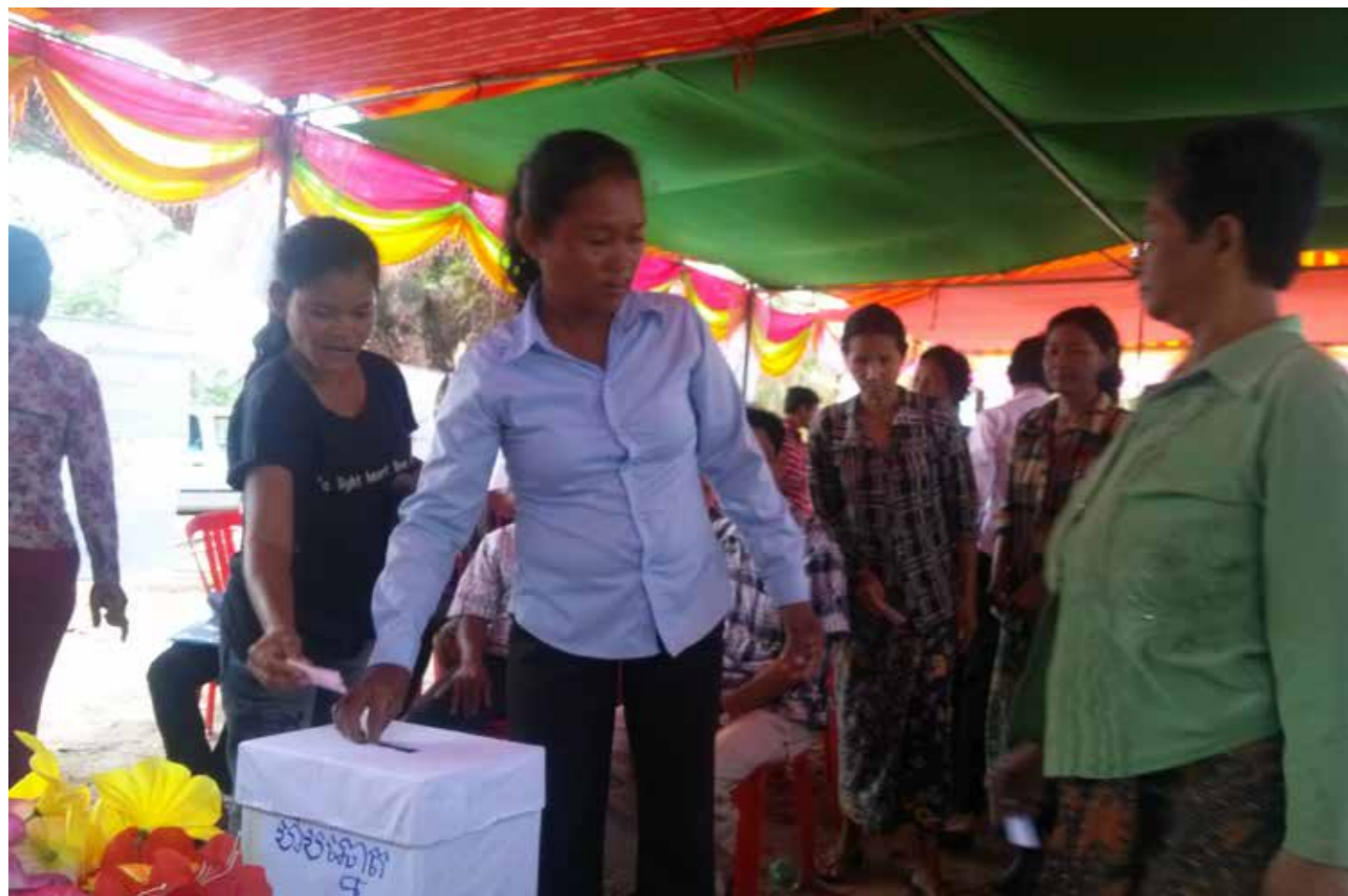
AC-medlemmer stemmer for at vælge de nye medlemmer af AC-bestyrelsen. AC står for agriculture cooperative, dvs. andelsforeningen.