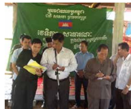
Myndighederne lytter til landsbyboerne, og man finder konstruktive løsninger

I forbindelse med de offentlige møder om den kommunale investeringsplanlægning, beskrev landsbyboerne i Bak Nim således deres konflikt i forhold til ejendomsretten til jord, tab af retten til at dyrke landbrug og tabt adgang til de traditionelle samlereaktiviteter i fællesskoven.