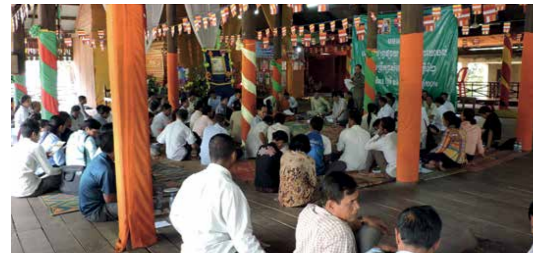
Ved det offentlige Forum-møde med myndigheder 26. august 2014 var grupperne mødt talstærkt op.