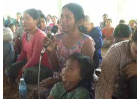
Fattige tager ordet i Bak Nim ved det store møde om jordrettigheder og medvirker til løse op for alvorlige konflikter om jorden. En kæmpe sejr for familierne, der deltager i CISOM-projektet og samarbejdspartnere.