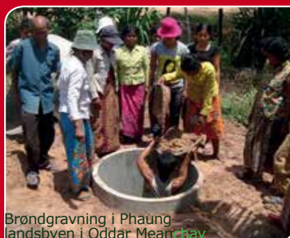
Brøndgravning i Phaung landsbyen i Oddar Meanchay